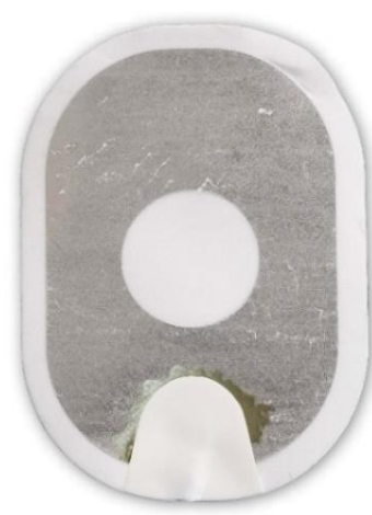
Figure 3 : gel presque complètement décollé du support.

Action : Appliquez les électrodes sur le patient. N'hésitez pas.