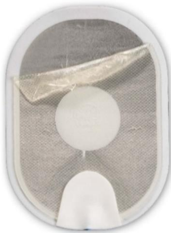
Figure 1 : gel décollé qui s'est replié sur lui-même lors du retrait de la feuille de protection.

Il est également possible que le gel se décolle presque complètement du support en mousse/étain lors du retrait de la feuille de protection (voir Figure 3.) Si la surface de contact du gel avec la peau est petite, un arc électrique peut se produire lorsqu'un choc est délivré, ce qui peut provoquer des brûlures sur la peau du patient. Il est aussi possible que le DAE ne puisse pas délivrer de choc à travers les électrodes. Un retard de traitement se produit lorsque l'utilisateur installe une cartouche d'électrodes de rechange (si disponible) ou effectue une RCP (réanimation cardiopulmonaire) ou un massage cardiaque en attendant l'arrivée du personnel des services médicaux d'urgence. À titre de comparaison, la Figure 4 montre une électrode normale. Quel que soit l'état de l'électrode, suivez les consignes vocales, car le DAE vous guidera tout au long des étapes nécessaires.