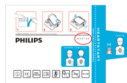
M5072A Sachet en aluminium