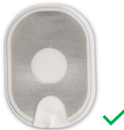
Figure 4 : électrode normale.