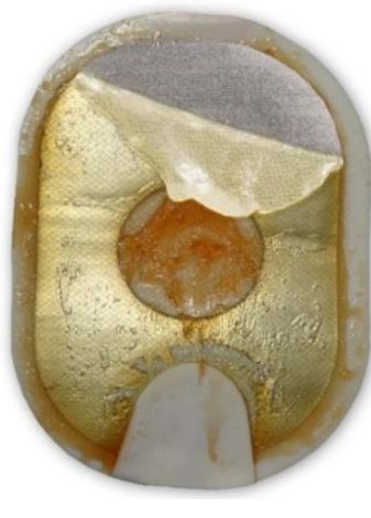
Figure 2 : le gel décollé et replié peut également sembler décoloré et/ou fondu.

Action : Appliquez les électrodes sur le patient. N'hésitez pas.